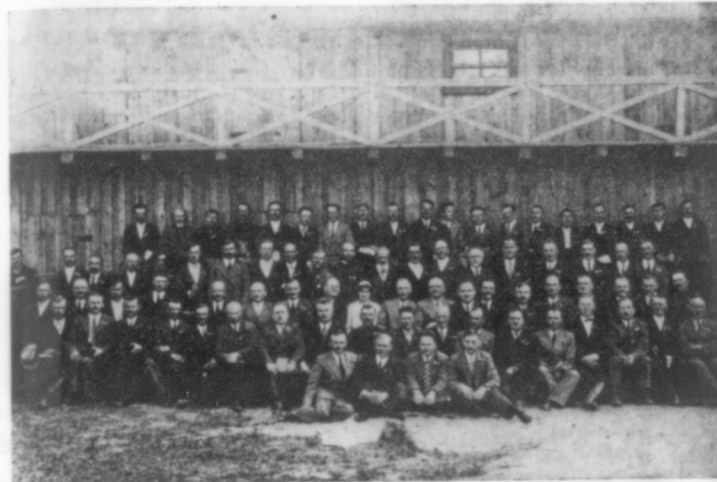
Die 10. Synode des Slavischen Bundes der Evangeliums-Christen in Polen

Sonntag, der 30. Juni, stand ganz für erbauliche und evangelistische Versammlungen zur Verfügung. Die Ordnung war folgende: Um 7 Uhr morgens eröffneten wir mit einer gesegneten Gebetsversammlung. Ihr folgte um 10 Uhr ein feierlicher Gottesdienst mit Evangeliumsverkündigung im Saale unseres Bundeshauses und abends 6 Uhr eine gleiche Versammlung in einem zu diesem Zwecke gemieteten großen Saale in der Stadtmitte. Alle diese Veranstaltungen standen unter dem sichtbaren Segen Gottes und brachten Freude und Stärkung.